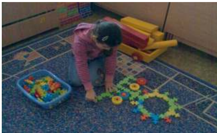
Kai liūdna – žaidžiu... (1/d „Justinukas“)