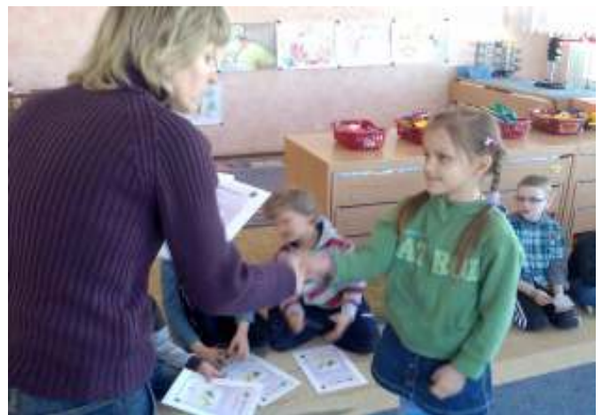
Mano pirmas diplomas