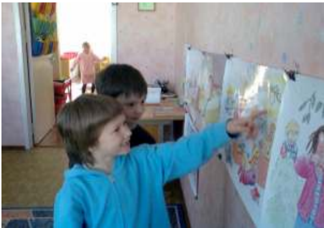
Man patinka vabaliukas