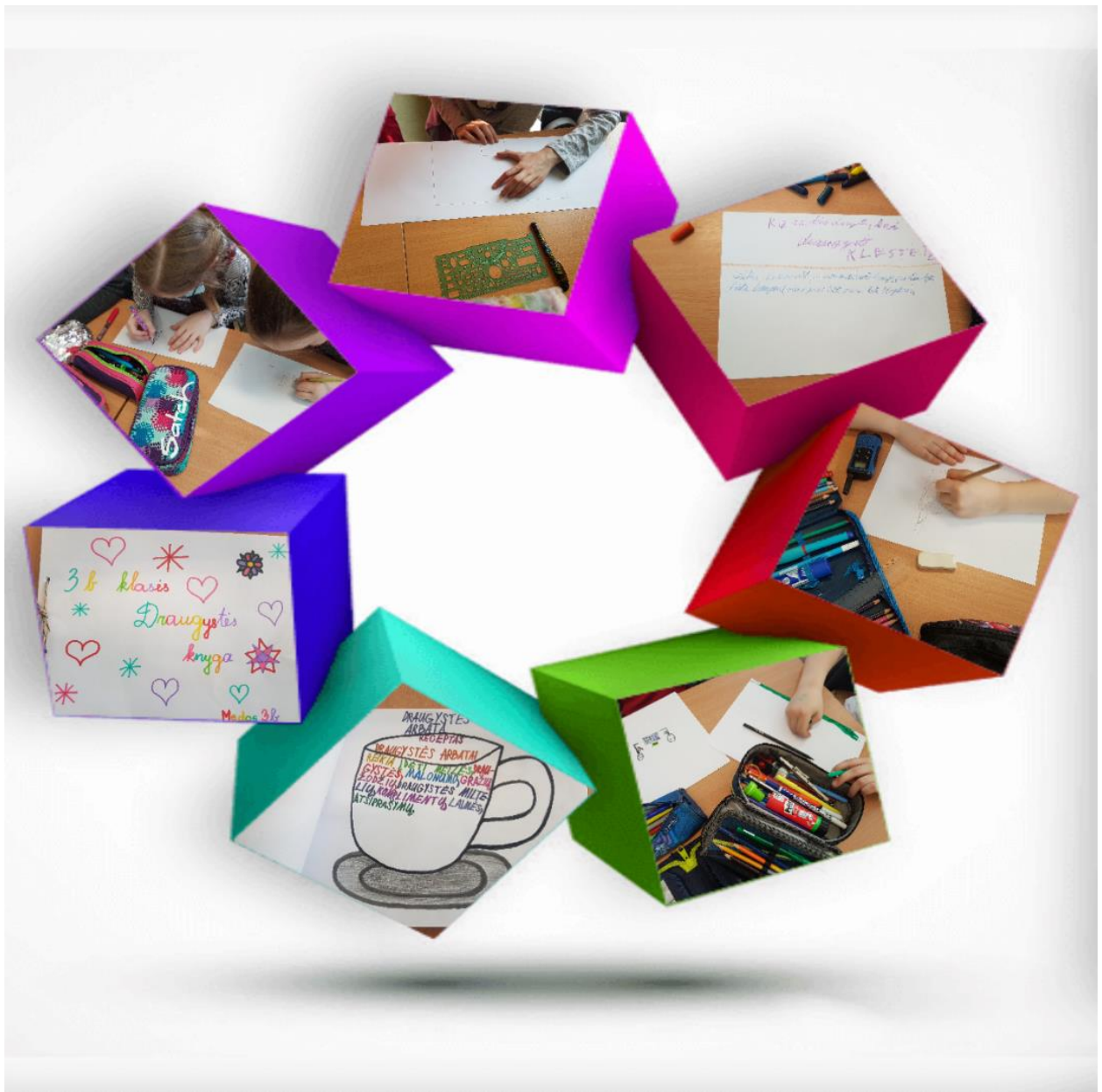
Vilniaus Šeškinės pradinės mokyklos socialinė pedagogė Daiva Bagdonienė